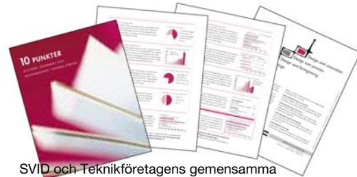
SVID och Teknikföretagens gemensamma undersökning Svenska företag om design - attityder, lönsamhet och designmognad finns att ladda ned på www.svid.se