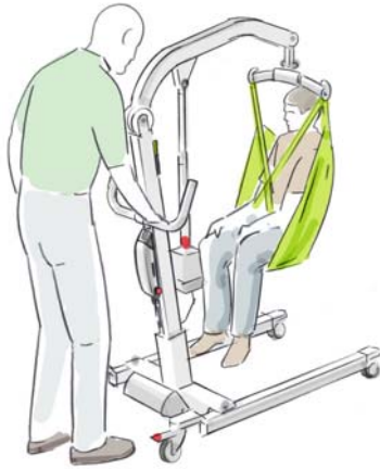
Strukturdesign har inom projektet Design för export av medicinsk teknik, arbetat med Likos patientlyftar.

Samverkan mellan teknik, ekonomi och design blir allt viktigare för att design skall bli en medveten del i företagens affärsstrategier. I projektet har totalt 1 750 personer deltagit vid seminarier och på utbildningar. En viktig del i projektet har varit det CD-baserade utbildningsverktyget DiA, Design i Affärsutveckling.