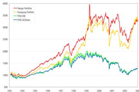
Börsutvecklingen för 166 brittiska företag som bedömdes vara designledande överträffade övriga noterade bolag. Källa: British Design Council, The Impact of Design on Stock Market Performance .