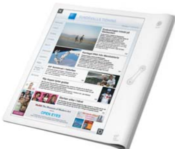
Framtidens tidning, ett delprojekt inom Design för tjänster. Design: Propeller.

I tider av stora kommunala förändringar, med utflyttning och svårigheter att attrahera nya företag, krävs nya inslag i kommunernas överlevnads- och tillväxtstrategier. Utifrån ett designperspektiv har en rad kommuner, däribland Orsa och Låxa, analyserats med fokus på hur kommunerna kommunicerar med invånarna och omvärlden.