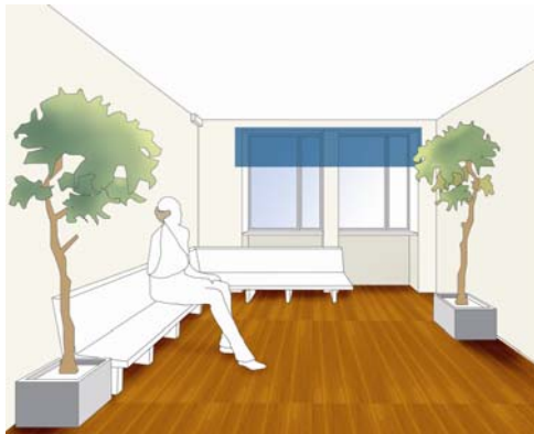
Akutmottagningen på Lindesbergs Lasarett utvecklades med hjälp av studenterna på Sommar-designkontoret i Hällefors 2005.

I Sommar-designkontoret arbetar studenter under sju sommarveckor tillsammans med små- och medelstora företag, kommuner och organisationer i uppdragsbaserade projekt. Uppdragen sker utifrån tre designområden: Produkter, tjänster eller positionering. Under åren 2003-2005 har 49 Sommar-designkontor genomförts runt om i landet, med totalt 336 uppdrag och 300 studenter.