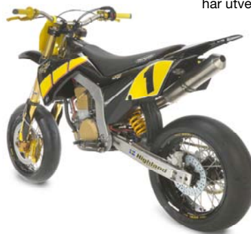
Cliff Design & Development har utvecklat nya designkoncept för Highland Motors.

Den svenska fordonsindustrin är en av Sveriges viktigaste branscher med 140 000 anställda. I projektet har syftet varit att genom design stärka konkurrenskraften bland underleverantörerna, vars framtid till stor del styrs av ökad global konkurrens. Ett drygt 40-tal företag har medverkat i projektet och tillsammans med designkonsulter utvecklat såväl produkter som designkoncept och övergripande profil. Projektet har genomförts med ProDesign/Chalmers och Västra Götalands Regionen i nära samarbete med Fordons Komponent Gruppen.