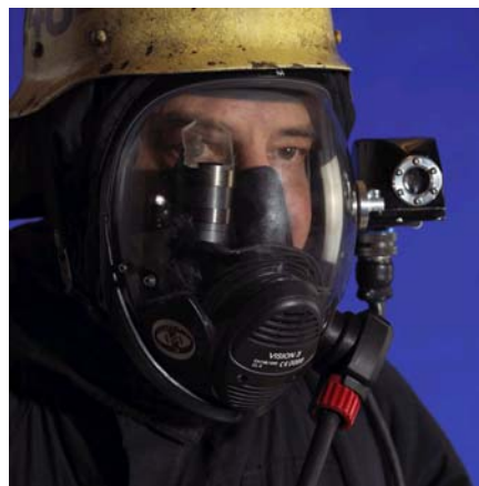
Rökdykarmask för Malmö Brandkår. Design: Zenit Design Group.

Utifrån ett antal prioriterade områden skapades nio näringslivsprojekt som utgjorde grunden för Design som utvecklingskraft. Dessutom skapades förutsättningar för ett intensifierat regionalt arbete under projektnamnet Regional utveckling, där SVIDs sju region- och lokalkontor samt 15 samarbetskontor bedrivit regionala designprojekt.